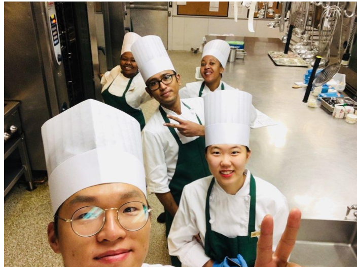
<사진 11> 동료들과 사진

도, 덴마크, 스페인, 한국 등 다양한 나라의 사람들과 함께 일하기 때문에 여러 나라의 문화와 언어를 경험하고 배울 수 있다. 다양한 나라의 사람들과 함께 업무를 수행하면서 평소 가지고 있던 선입견을 버릴 수 있는 개기가 되었으며, 서로의 다름을 이해할 수 있었다. 그리고 같은 일을 처리할 때에도 모두 다른 방식을 이용하기 때문에 더욱 효율적인 방법을 찾아 일을 빠르게 처리할 수 있었다. 업무시간 뿐 아니라 업무 후에도 함께 식사를 하거나 티타임을 가지며 서로의 나라에 대하여 이야기를 들을 수 있었으며, 홈파티 등을 통해서 서로의 나라의 음식을 경험할 수 있는 좋은 시간이었다.