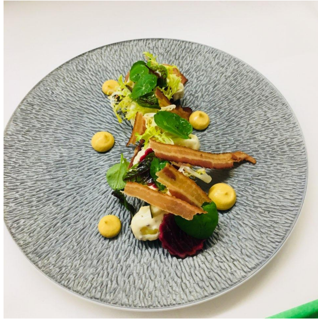
<사진 23> 감자 샐러드

14주차에는 셰프와 함께 새로운 메뉴를 창작했다. 레스토랑 리뉴얼이 다가오고 있었기 때문에 셰프와 함께 새로운 메뉴를 개발했다. 항상 하던 업무와 함께 새로운 업무를 하게 되어서 새로웠고 더욱 보람찼다. 물론 메뉴를 창작하는 것이 어려웠지만 동료들과 함께 상의하고 셰프와 고민하다보니 어느새 새로운 메뉴를 만들 수 있었다.