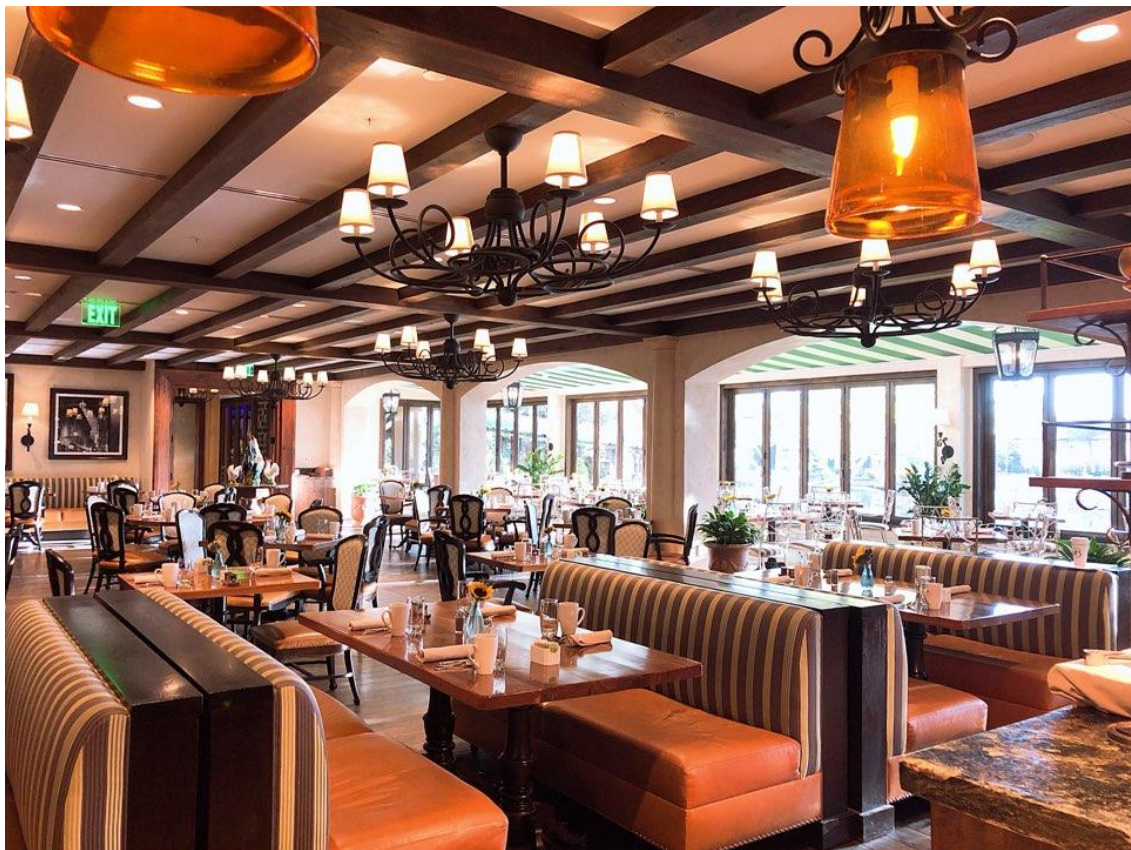
<사진 16> 레스토랑 "델라고"