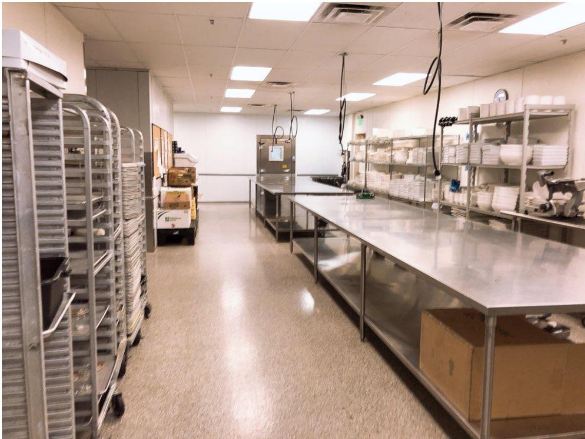
<사진 15> Banquet 주방