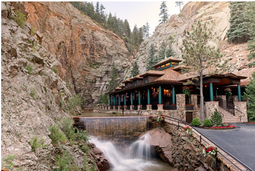
〈사진 5〉 협곡에 위치한 호텔 레스토랑