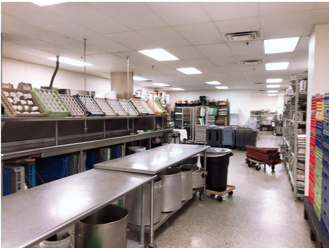
<사진 14> Banquet 주방