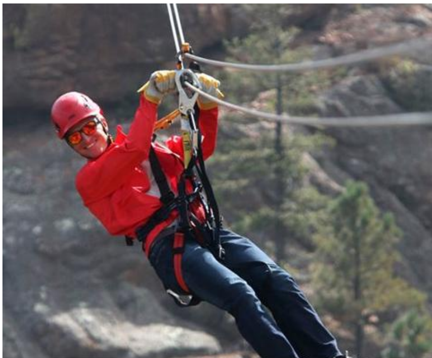
<사진 7> 하이킹 코스