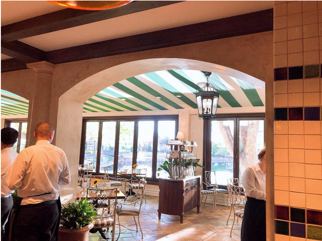
<사진 17> 레스토랑 "델라고"