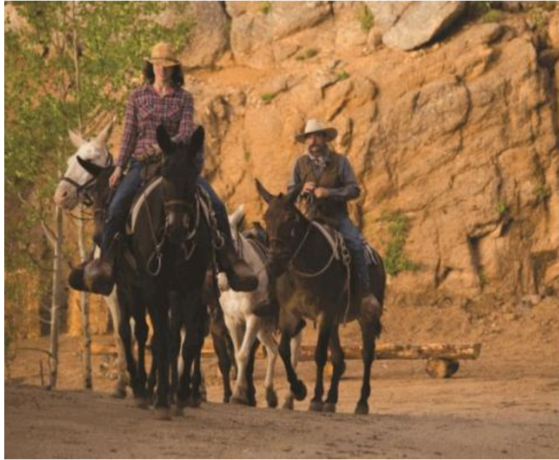
〈사진 4〉 승마 코스