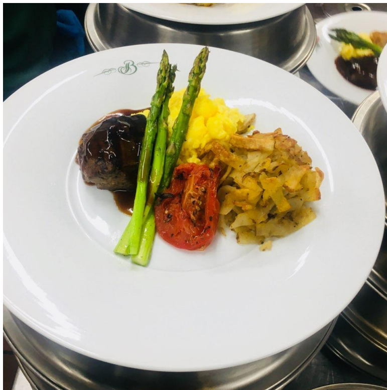
<사진 19> 단체 Plate up 메뉴

2주차에는 연회 Plate up 및 아침, 점심 연회를 준비했다. 연회의 특성상 보통 뷔페 형식으로 서비스 되는 음식과는 다르게 고객마다 접시로 서비스되는 음식들이 있다. 따라서 음식을 먼저 만든 후 접시에 하나씩 옮겨 담는 작업을 하는데 이를 한국에서는 플레이팅이라 부르는 데 이곳에서는 Plate up 이라 칭한다. 이는 많은 동료들과의 팀워크가 중요한 작업이라 뷔페음식과 함께 준비하는 것이 힘들기는 했지만 함께 일하는 즐거움을 느낄 수 있었다.