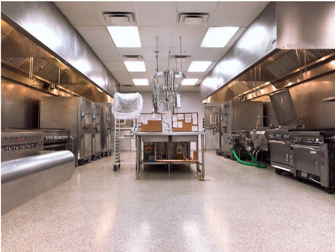
<사진 12> Banquet 주방

에서 근무했으며 새벽 4시부터 오후 2시까지 근무하며 단체 아침과 점심을 준비했다. 5월부터 근무한 이탈리아 레스토랑인 델라고는 Breakfast 팀과 Lunch 팀, Dinner 팀 그리고 Pastry 팀으로 나누어져 있으며 나는 Breakfast 팀에서 새벽 4시부터 오후 2시까지 근무하며 조식 뷔페와 아침 메인 메뉴 파트를 맡았다.