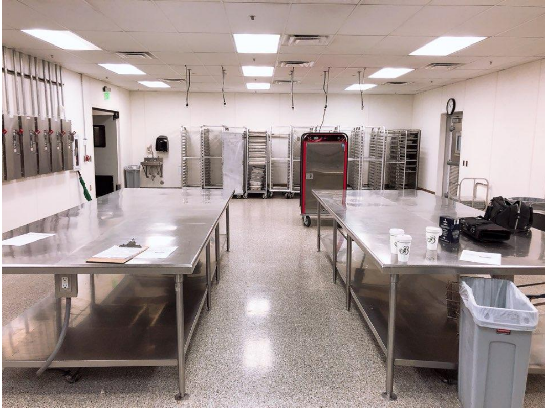
<사진 13> Banquet 주방