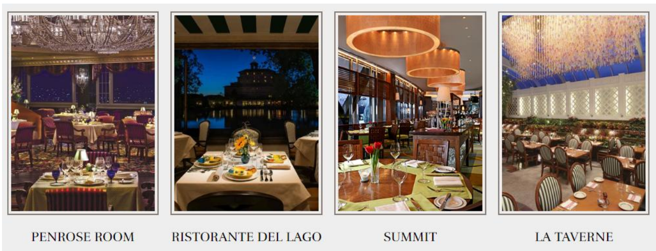
〈사진 8〉 브로드무어 호텔의 대표적인 레스토랑

브로드 무어 호텔은 와인과 멋진 산의 전망이 완벽하게 어우러져 계절마다 바뀌는 신선한 맛을 즐기실 수 있다. 콜로라도 주의 유일한 5성급 레스토랑인 Penrose 레스토랑 및 10개의 레스토랑과 10개의 카페 및 라운지를 가지고 있다. 따라서 브로드 무어 호텔의 요리사들은 총 20개의 레스토랑들을 경험하며 자신의 역량을 강화 시킬 수 있다. 또한 요리사들도 서비스 교육을 철저하게 받기 때문에 본인이 원한다면 서버나 하우스키핑 등 다양한 직무를 경험할 수 있다.