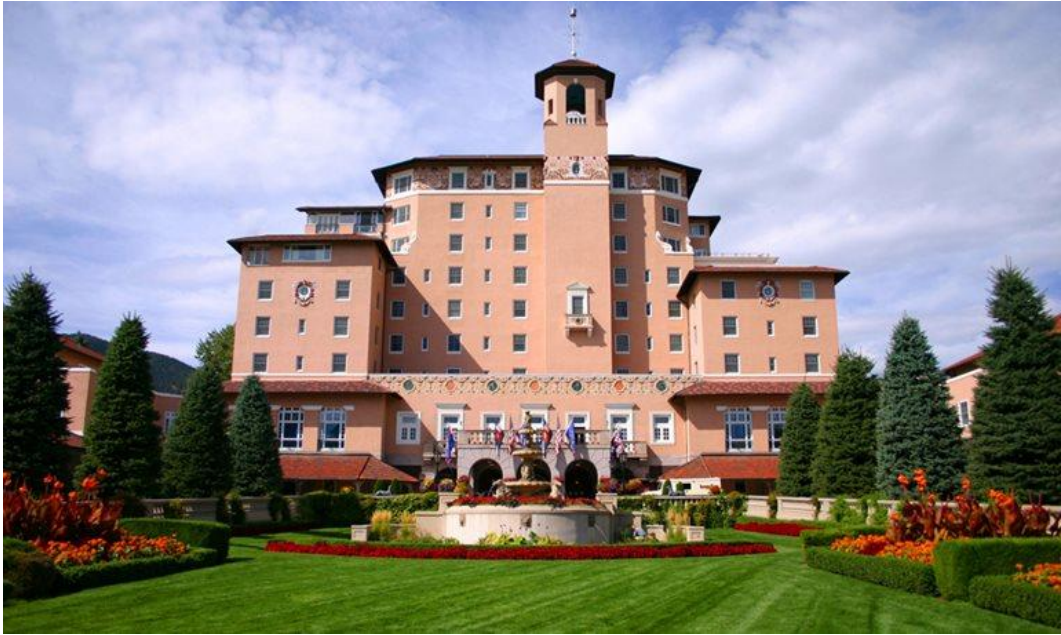
〈사진 1〉 브로드무어 호텔