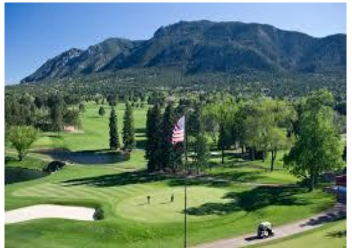
〈사진 3〉브로드무어 골프 코스