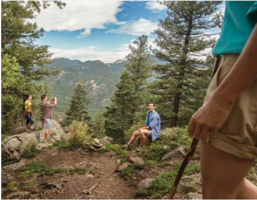
<사진 6> 하이킹 코스