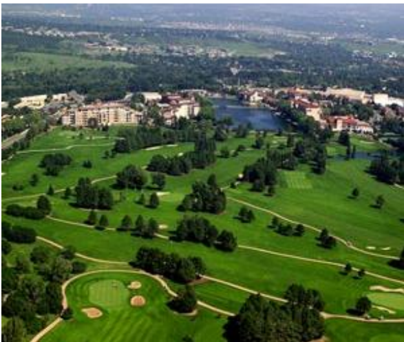
〈사진 2〉브로드무어 골프 코스