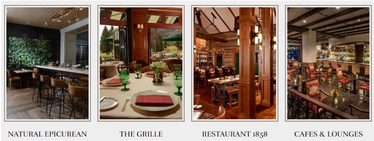
〈사진 10〉 브로드무어 호텔의 대표적인 레스토랑

내가 일하고 있는 브로드무어의 요리파트는 단지 주방 안에서의 조리만 담당하는 것이 아니라 브런치나 연회 행사등 고객들의 앞에서 라이브로 요리를 선보이는 파티이기 때문에 단순한 조리 기술 뿐만 아니라 고객을 응대하는 서비스 정신 또한 매우 중요하다. 따라서 주기적으로 서비스 교육을 받고, 매일 셰프 및 서버들과 함께하는 라인업을 통하여 당일 중요한 VIP 및 서비스에 대한 정보를 교환하고 상기하는 시간을 가진다. 이러한 제도를 통하여 호텔이 직원들에게 말하고자 하는 것은 요리를 하는 요리사, 고객을 직접 마주하는 서버, 그리고 심지어는 사무실에서 업무를 하는 직원들 즉, 브로드 무어 호텔에서 근무하는 모든 직원들은 서비스직에 종사하는 사람들로써 늘 호텔에 방문하는 고객들을 살펴보고 그들의 편안함과 행복을 최우선으로 해야 한다는 것이다. 따라서 호텔에서는 길을 지나다 마주치는 모든 사람들에게 인사를 건네는 것이 규칙이며 고객들뿐 아니라 직원들 간에도 늘 밝은 미소와 인사를 건네어 업무 중 조금이나마 행복한 마음으로 일하는 것에 초점을 맞추고 있다.