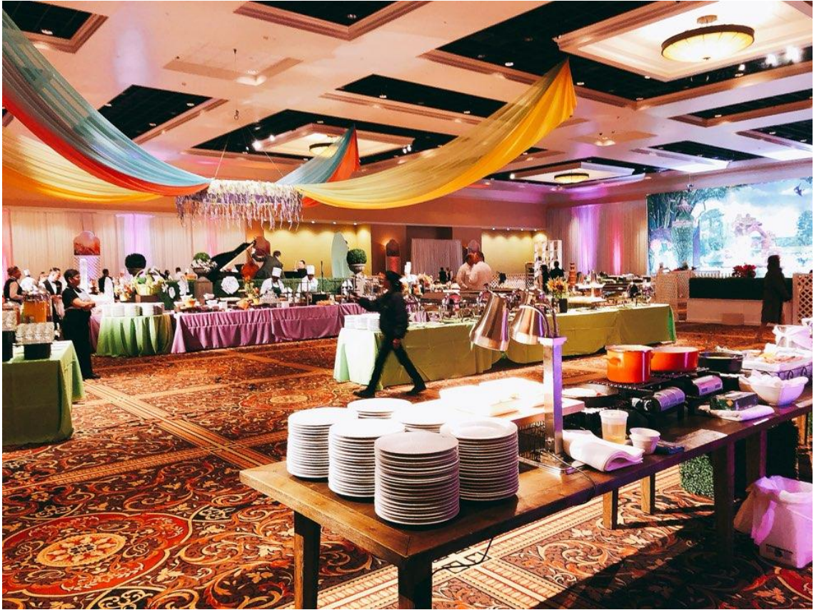
〈사진 21〉 부활절 행사