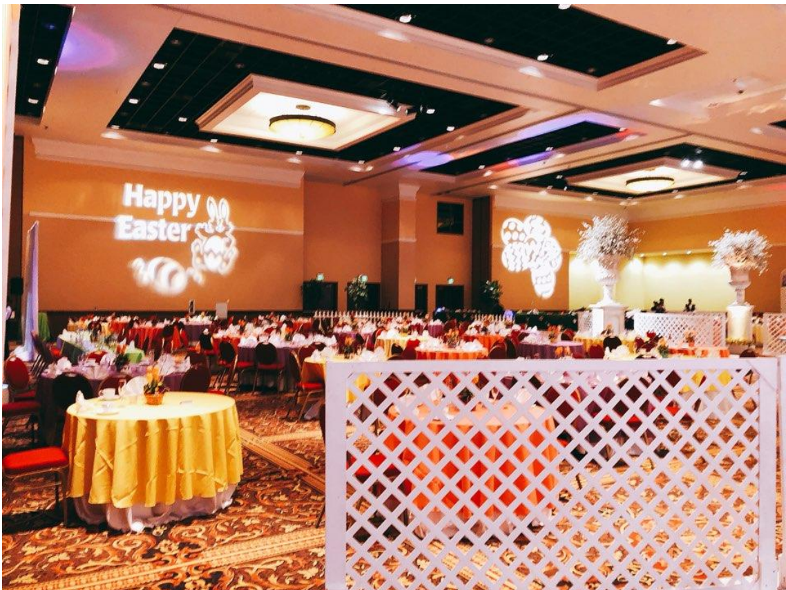
<사진 20> 부활절 행사

4주차에는 4월 1일에 있을 부활절 행사를 준비했다. 내가 인턴 시작 후 가장 많은 인원을 수용하는 브런치 행사였으며, 1년 동안의 호텔 행사 중 중요한 행사였기 때문에 이러한 곳에서 라이브 조리를 할 수 있는 기회를 얻었다는 것에 매우 뜻깊었고, 고객들의 요구에 맞는 조리를 하는 것에 조금의 어려움이 있기는 했으나 고객과 함께 대화를 나누며 고객들의 반응을 즉각적으로 느낄 수 있어서 보람된 주였다.