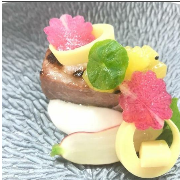
<사진 24> 안심 스테이크