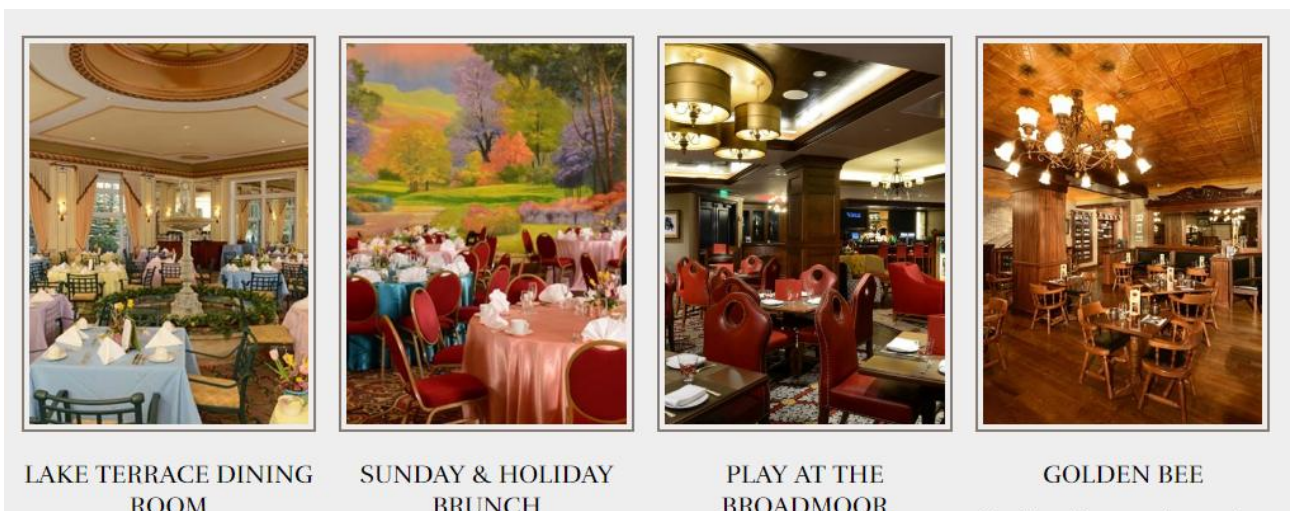
〈사진 9〉 브로드무어 호텔의 대표적인 레스토랑