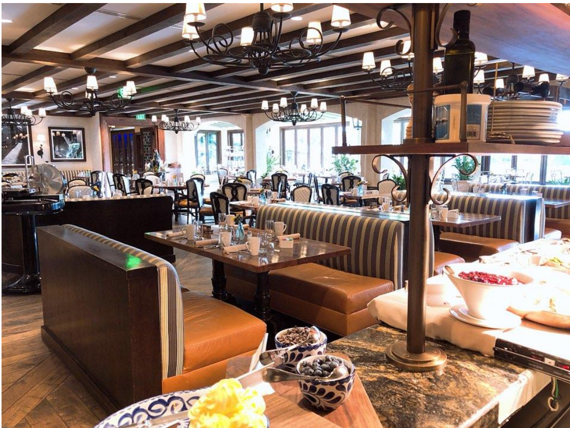
<사진 18> 레스토랑 "델라고"